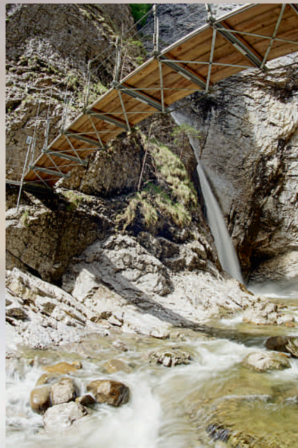
«Chessiloch» Wasserfall und Hängebrücke

Wanderung ab Flühli Dorf rund 60 Minuten.