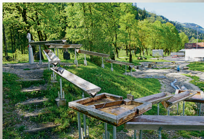
Wasser-Spielplatz an der Waldemme in Flühli.

Wanderung ab Flühli Dorf rund 60 Minuten.